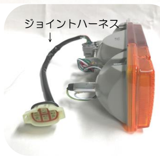
③灯体側面とコネクタ